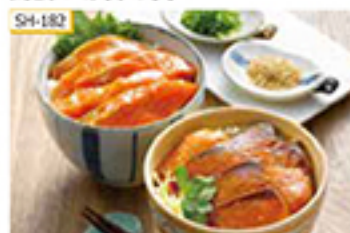
SH-182 づけサーモン・ジリのヒリ辛づけ 各60g×4食

ご飯を添えたお茶碗に、解凍した切身をのせるだけで、づけサーモン丼や、ぶつ切のヒリ辛づけ丼がご家庭で手軽にお召し上がりいただけます。お好みで刻みのりやワサビを添えてご賞味ください。