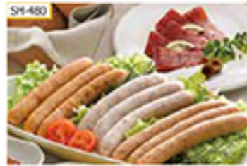
SH-480 〔生ハム〕40g×2袋 〔ソーセージ〕プレーン・ガーリック・ハーブ 各90g

豚身の少ないもも肉を使った黒毛和牛の生ハムは、しっとりとした食感と深みのある味わいをお楽しみいただけます。3種のソーセージはフライパンで焼いたり、袋のまま湯煎をして温めるなど、お好みの調理法でお召し上がりください。