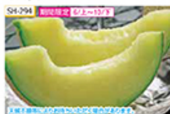
SH-294 送料別定 5/1～5/31 1.2kg(1玉)

細かいネット模様の皮に包まれたマスクメロンは、芳醇な香りを持つ肉厚の果肉が特長です。表皮全体が黄色味を帯びてきて、香りが強くなるまで常温で熟成させ、食べる2～3時間前に冷やしてお召し上がりください。