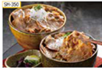
SH-350 100g(真コース肉90g×たれ20g)×4袋

温暖な気候で大切に育てられた、九州産黒豚の真コース肉をスライスして、しょうが焼き用のたれで味付けしました。千切りキャベツや紅生姜などを添えてお召し上がりください。