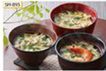
SH-895 甘えび・真しんじょう汁 各30g/計90g×2セット

「新宿割烹中嶋」の中嶋料理長が監修した、お湯を注ぐだけの手軽さで、長期保存も可能なフリーズドライ製法のお吸い物です。真ん中、甘えび、舞茸の3種類をご用意しました。