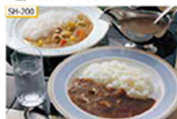
SH-200 ビーフカレー(中辛口)・ベジタブルポークカレー(甘口) 各200g×4食/計8食(レトルトパック)

玉ねぎを茹こけるまでソテーして甘みとコクを引き出し、牛肉やトマトピューレなどの材料を加えて煮込んだ中辛口のビーフカレーと、豚肉と野菜をじっくり煮込んだ甘口タイプのベジタブルポークカレーのセットです。