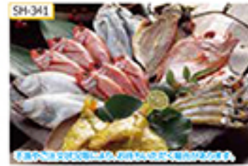
SH-341 のどろろ(アカムツ)丸干し6尾、にぎす丸干し5尾、のどろろ(アカムツ)開き味噌漬・あじ(マアジ)開き干し1尾、にぎす丸干し1尾、連子開き干し1尾

山陰沖で獲れた魚にこだわった干物の詰合せです。小ぶりながら旨味の詰まったのどろろ丸干しや連子開き干しなど、それぞれの魚の美味しさを堪能してください。