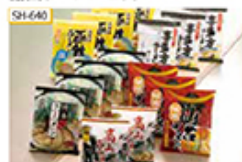
SH-640 〔乾麺〕北海道産豚(味噌・博多(とんこつ味) 各4食、仙台(味噌味)・喜多方(醤油味) 各3食、岐阜(醤油味)2食/計16食(各80g×スープ付)

郷土色豊かなその地方ならではの味を再現したご当地ラーメンです。麺は生麺を低温でじっくり熟成乾燥させ小麦の風味をしっかりと閉じ込め、噛み締めれば生麺のような味わいを楽しめます。