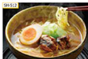
SH-512 〔生麺〕130g×7食(味噌スープ付)、黒豚角煮7袋

柔らかな煮込んだ九州産黒豚の角煮とコクのある味噌スープが、手頃な大きさのめんが食感の生麺によく合います。お好みでネギやメンマを添えてお召し上がりください。