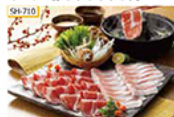
SH-710 真コース肉・ばら肉 各270g/計540g

イベリア半島(主にスペイン南西部)で育てられた、イベリコ種(血統50%以上)の豚のうち、スペイン政府による認証を受けたものがイベリコ豚と呼ばれます。その旨味と甘みがつまったイベリコ豚の真コース肉とばら肉をしゃぶしゃぶ用にスライスしてお届けします。