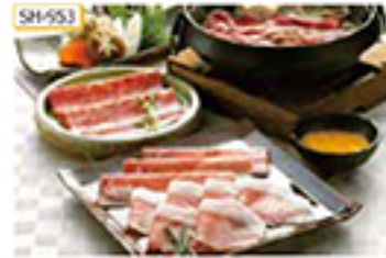
SH-553 〔黒毛和牛〕ばら肉200g 〔黒豚〕コース肉6も肉 各100g/計200g

国産の黒毛和牛と九州産の黒豚を一度に楽しめるすきやき肉の食べ比べセットです。旨味の違いをお楽しみください。