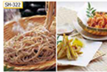
SH-322 〔生麺〕260g(130g×2食)×2袋/計4食、わかさぎ唐揚げ・小海老唐揚げ(加納用・衣付) 各150g

国産のそば粉を100%使用した冷涼の生そばと、から揚げ用に粉付けした信州産わかさぎと小海老(すじえび)のセットです。家々たまかっつと揚げた十割そばと一緒に召し上がりください。