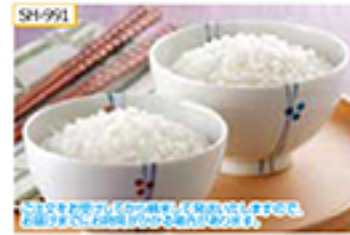
SH-991 山形県産はえぬき5kg、山形県産コシヒカリ2kg

東北の米どころ山形県から、「はえぬき」と「コシヒカリ」のセットをお届けします。お米の粒がしっかりと、モチモチの食感が特長の「はえぬき」と、色が白く、粘りとツヤ、弾力がある「コシヒカリ」とも、ご注文をいただいてから精米してお届けします。