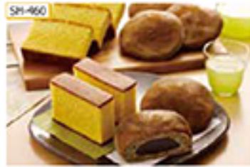
SH-460 長崎かすてら(カット)8個、黒ごまどら焼き8個

江戸時代末期の文化8年(1811年)、長崎県鎌早川にて創業した杉谷本舗。良質な小麦粉と地元産の新鮮な卵を使用した、しっとりとしたコクのある風味の長崎かすてらと、他にも生地にも黒練りごまを加えた黒ごまどら焼きのセットです。