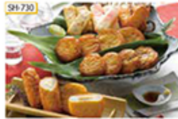
SH-730 明太小丸40g×2枚、チーズ38g×2枚、丸天30g×2枚、さつま子こぼれ入替 各27g×2枚、特天・紅しょうが野菜 各20g×3枚/計21枚

鹿児島県・薩摩地方が発祥といわれているさつま揚げ。魚肉のすり身にチーズや紅しょうがなどの素材を使用し、彩りよく風味豊かに仕上げました。保存に便利な真空パックに入れてお届けします。