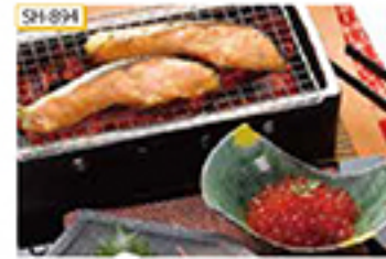
SH-894 銀鮭西京漬け70g×4切、いくら醤油漬け40g

適度に脂ののった銀鮭の西京味噌漬けは、余分な水分を抜いてから漬けているので味が中までしみ渡ります。口どけがよくまろやかな味わいの北海道産いけらの醤油漬け、どちらもアツアツのご飯によく合います。