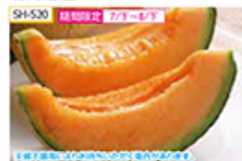
SH-520 送料別定 7/1～8/31 1.3kg(1玉)

昼夜の寒暖の差が大きい環境で、甘味と香りを増した北海道産メロンは、きめの細かいめらかな果肉が魅力です。道産熟して食べ頃になりましたら冷蔵庫で冷やしてお召し上がりください。