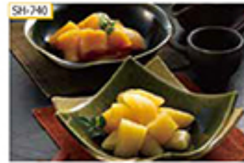
SH-740 白濁り黒濁り 各80g×3袋

塩抜き不要で手軽に食べられる味付数の子2種セットです。数の子本来の色や旨味を大切に仕上げた白濁り、しっとりとした黒濁り、お好みとした数の子特有の歯ごたえをお楽しみください。