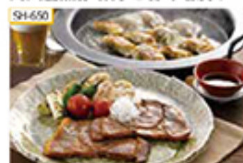
SH-650 〔餃子〕20g×10個入×2パック/計20個 〔甘味噌漬け〕100g(もも肉80g×たれ20g)×4袋

温暖な気候で大切に育てられた九州産黒豚の餃子と、甘味噌漬けをセットでお届けします。ご飯のおかずにも、お酒の肴にもおすすめです。