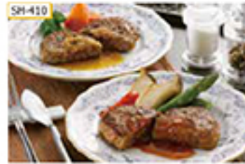
SH-410 宮崎県産黒毛和牛生ハンバーグ100g×2個、国産合挽き生ハンバーグ100g×2個入×3袋/計10個

宮崎県産黒毛和牛の牛肉をベースにした宮崎県産黒毛和牛のハンバーグを、ジューシーで旨味あふれる宮崎県産黒毛和牛生ハンバーグ、国産合挽き生ハンバーグとセットでお届けします。