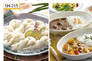
SH-215 〔乾麺〕手延べ素麺(長期熟成)50g×17束、ビーフカレー(中辛口)・ベジタブルポークカレー(甘口) 各200g×2食/計4食(レトルトパック)

江戸時代から長崎県・島原半島で作られてきた島原素麺。そのなかでも希少にこだわって製造し、さらに一年以上かけて熟成させた素麺と、2種類のカレーをセットにしてお届けします。