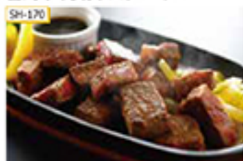
SH-170 6も肉240g(ヒマラヤ岩塩付)

国内屈指の黒毛和牛の産地・宮崎。太陽と緑に恵まれた地で、生産農家の愛情を一身に受けた「宮崎牛」をお届けします。お好みでヒマラヤ岩塩をつけてお召し上がりください。